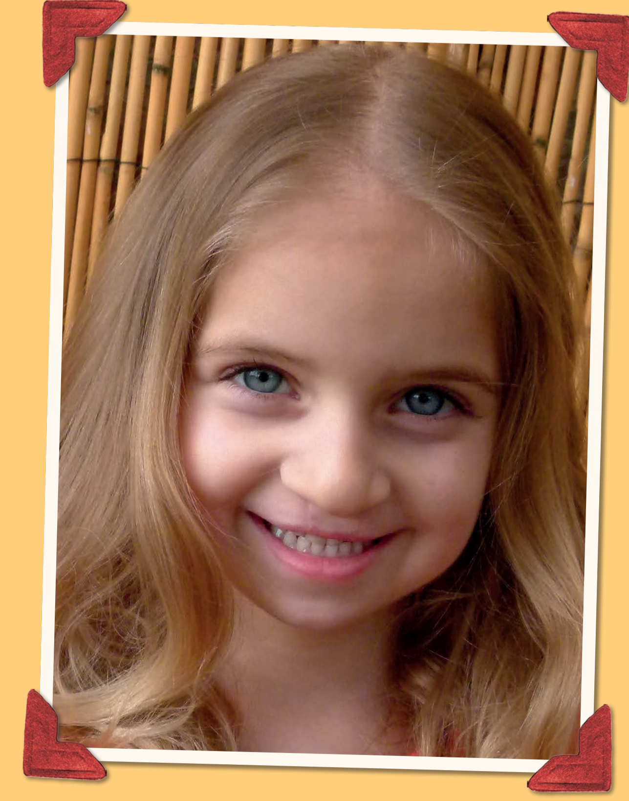
Lenka rozštěp oboustranný

Chcete se dozvědět více? Chcete pomoci? www.stastny-usmev.cz